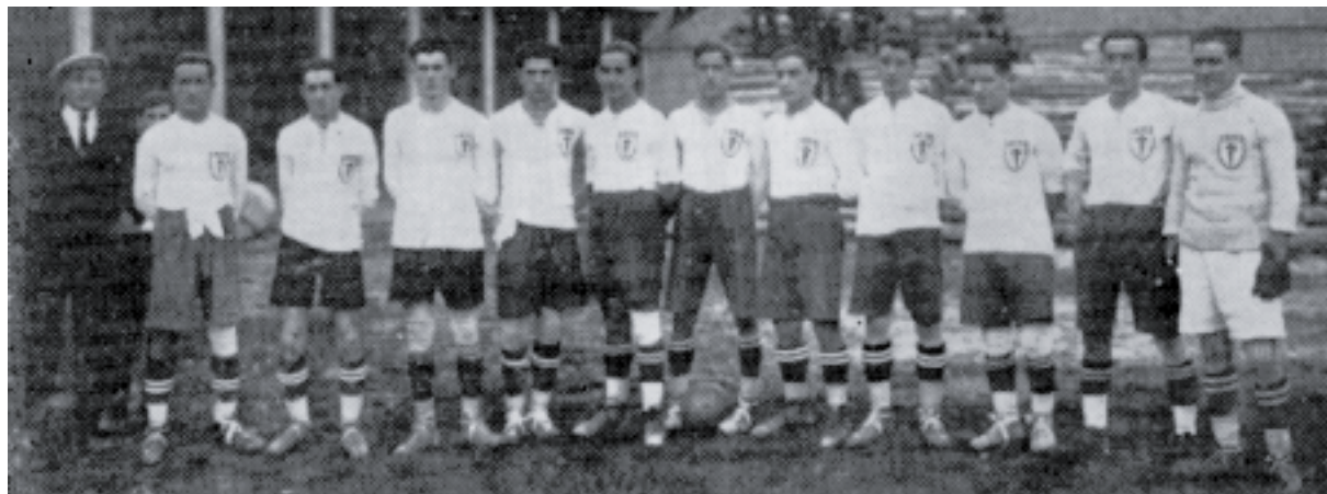
Velaquí o primeiro once de Galiza, coa camisola branca e a cruz de Santiago no peito.

A selección galega non é cousa de agora. Galiza, país pioneiro no fútbol peninsular, armou o seu primeiro combinado nos anos vinte, hai agora diso 83 anos. Castela, Inglaterra ou Lisboa foron algúns dos equipos derrotados pola selección do noso país.