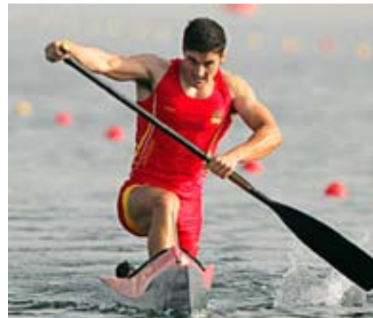
O palista do Hío, David Cal, conseguiu un ouro e unha prata nas olimpíadas de Atenas de 2004

Como caso especial está a Liga Nacional de Billarda, que non puido constituírse como federación xa que non está oficialmente considerada como deporte pero que conta cun alto nivel e cun bo número de afeccionados en Galiza.