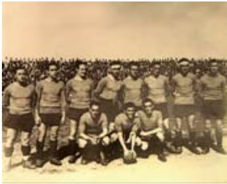
Un dos combinados galegos que disputou partidos nos anos cincuenta.