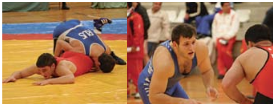
Galiza é unha potencia no panorama da loita libre e grecorromana no estado español

P iragüismo, loita, rugbi, billarda, vela, triatlón... son só algúns dos deportes nos que Galiza se erixiu como potencia, coa única pexa de que ningún conta con selección galega con carácter oficial. Agora que o fútbol fai a súa estrea, as correspondentes federacións queren aproveitar para reivindicar a equipación co dito «deporte rei».