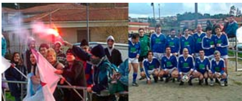
Seareiros do Compos, Celta e Deportivo citáronse na Estrada para promover a creación da selección galega co apoio dun equipo de intelectuais e xornalistas