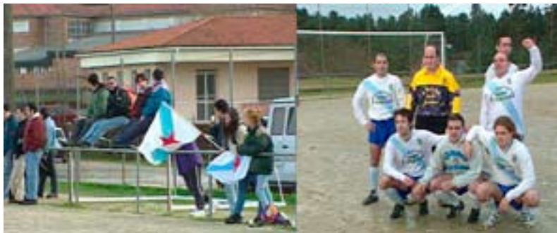
A afeción volvou co equipo do Seareiros que finalmente gañou o partido por 7 a 2